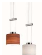
Up and Down